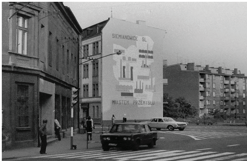
Zdjęcie 2. Mural w centrum Siemianowic Śląskich z okresu PRL.

SIEMIANOWICE ŚLĄSKIE POŁOŻONE SĄ W centrum konurbacji górnośląskiej, obok takich miast jak: Katowice, Chorzów, Piekary Śląskie, Czeladź oraz Wojkowice. Dzieje miasta są ściśle związane z industrializacją całego regionu, rozpoczętą pod koniec XVIII w. i trwającą na przestrzeni XIX i XX w. Do 1989 r. Siemianowice postrzegane były jako typowe miasto węgla i stali (patrz Zdjęcie 2.). Na jego obszarze na przestrzeni lat powstawały liczne kopalnie węgla kamiennego, huta stali (jej początki datowane są na 1836 r.) oraz mniejsze zakłady przemysłowe, jak chociażby fabryka kotłów parowych Fitznera. W 1969 r. funkcjonowały na terenie miasta dwie kopalnie: „Michał” i „Siemianowice”, huta „Jedność”, Zakłady Cukiernicze „Hanka”, Fabryka Śrub i Nitów, centralny zakład przedsiębiorstwa „Kotłomontaż” oraz duże zakłady mechaniczne (Liszka, 1969, s. 6). Po transformacji ustrojowej w 1989 r. większość z tych zakładów została zlikwidowana, co spowodowało, że bezrobocie w mieście sięgnęło w 2004 r. około 30% i było jednym z najwyższych w kraju (Stopa, 2004).